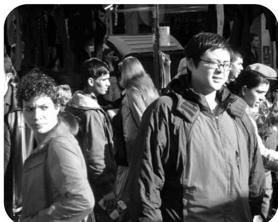
El pla de convivència és un dels exemples més clars que podem trobar de política de participació d'aparador.

tra passa el mateix. En aquest cas, a través de les ordenances de neteja colomenques. Quantes multes s'han rebut ja a causa de cartells, adhesius, pancartes...? On se suposa que ens hem d'expressar les persones en aquesta ciutat? La manca d'espais, cada cop més acusada, no deixa de ser una estratègia ben clara de reprimir allò que no interessa a la Casa Gran.