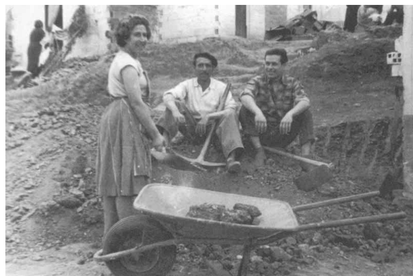
Les barriades de la Serra d'en Mena van créixer durant els anys seixanta a partir de l'autoconstrucció.

A part d'aquestes entitats n'hi ha que no són representades ni al consell de barri, ni a les comissions del pla, senzillament perquè no han estat convidades, potser perquè no interessa. Em refereixo al Centre d'Acolliment, on participen molts i moltes ciutadanes, més de tres-centes persones, que no són representades enlloc més per les seves dificultats en desenvolupar-se en el teixit social, també, perquè no tenen dret a vot. Si que hi són a la comissió associacions ben petites en comparació. De què va realment aquesta participació? on és el sentit real d'aquesta participació quan les entitats reben un projecte completament definit i només poden fer al·legacions? L'Ajuntament es vanagloria d'haver fet cas a dues, sí senyor, dues propostes de les entitats. Si jo fos periodista professional i tingués el temps que cal tenir, aniria a parlar amb totes aquestes entitats, a veure què en pensaven de la comissió de barri, del pla de la Serra d'en Mena i del fet que s'utilitzi el seu nom en pamflets de propaganda partidista que és el que és aquesta publicitat pagada per tothom. Tornant al Centre d'Acolliment: és ben curiós que un pla tan declaradament participatiu contempli unes obres al centre cívic