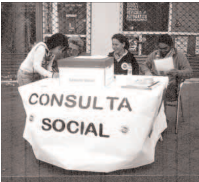
La nostra ciutat ja té tradició fent consultes populars. A la foto, taula de la Consulta social per l'abolició del deute extern realitzada el març de 2000.

1. La Constitució Europea, seguint la lògica de la Unió Europea, no garantirà plens drets socials i de ciutadania per a totes les persones, com poden ser l'ocupació digna, habitatge, sanitat, educació, jubilació justa, cultura, medi ambient saludable, residència lliure i lliure circulació de persones.